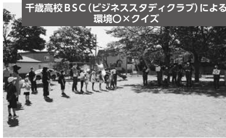
千歳高校BSC(ビジネススタディクラブ)による環境〇×クイズ