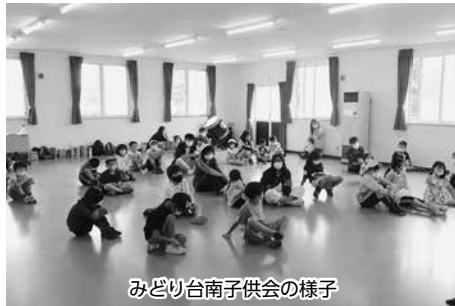
みどり台南子供会の様子

まず子供会を立ち上げてジュニアリーダーを育成し年2回の子供会を計画しています。5mの大型スクリーンでアニメ映画を見せて、シニアリーダー「つばさ」の協力を得てレクリエーションゲームを行います。