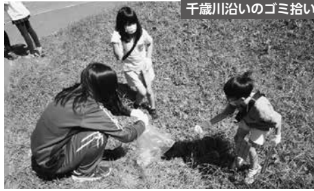
千歳川沿いのゴミ拾い