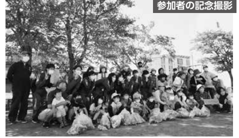
参加者の記念撮影