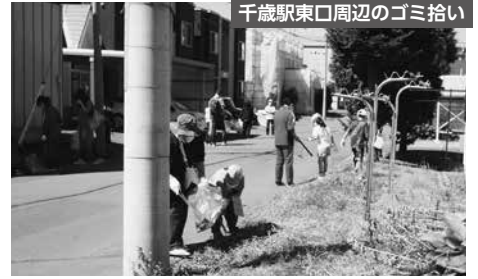
千歳駅東口周辺のゴミ拾い