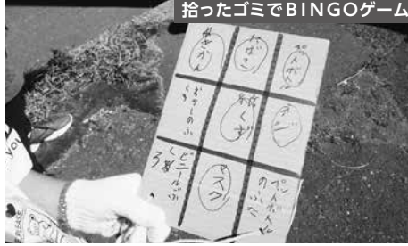
拾ったゴミでBINGOゲーム