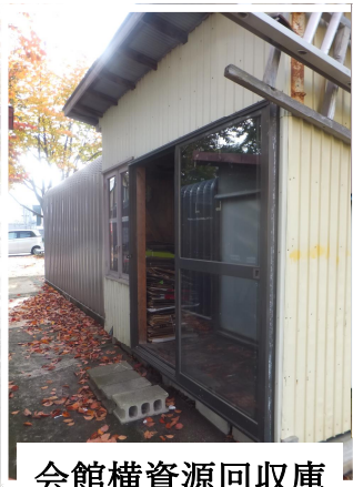
会館横資源回収庫