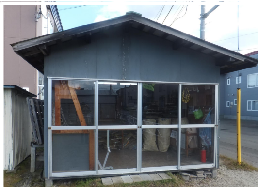
4区タイヤ公園横資源回収庫