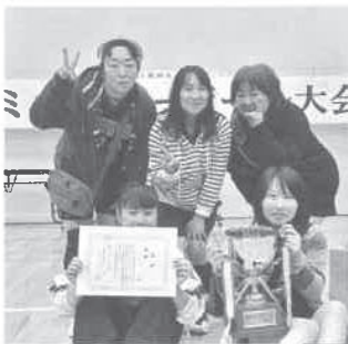
優勝した富丘Bチーム