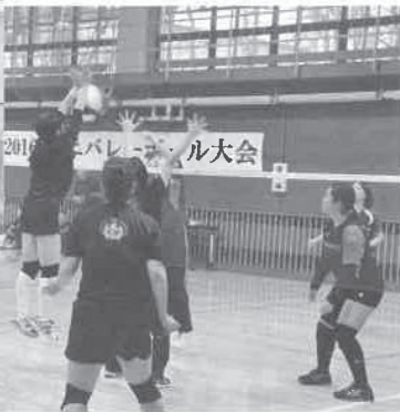
白熱した試合が繰り広げられました

平成7年より開催しているミニバレーボール大会も今年22回目を迎え、11月20日（日）8時45分から、第1会場を北桜コミュニティセンター、第2会場を北信濃コミュニティセンターとし、各コミュニティ協議会より20チーム93名の参加によりトーナメント方式で試合を開催しました。 今年は富丘コミュニティ協議会所属チームが11年ぶりに優勝しました。 結果 優勝：富丘Bチーム 準優勝：祝梅Cチーム 3位：祝梅Aチーム 4位：北桜Dチーム