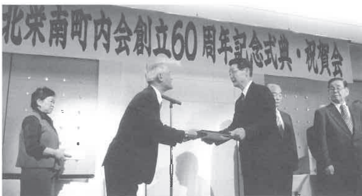
永年のご苦勞に感謝状を贈呈

60周年の節目を祝い、町内会の一層の発展を祈念して乾杯。小中高生の楽器演奏、日本舞踊などを楽しみながら会員同士が和やかに懇親を深めました。