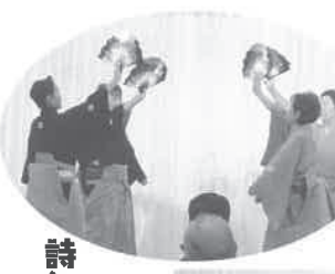
詩舞の秋桜(こすもす)