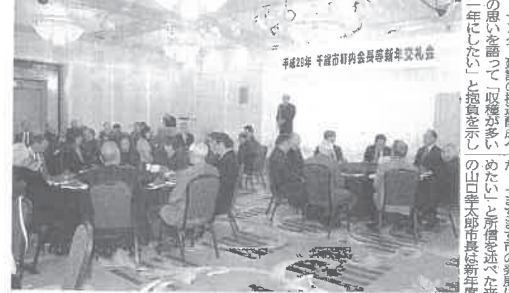
町内会長らが一堂に集った新年交礼会

千歳市町内会長等新年交礼会(市町内会連合会主催)が2月3日、ホテルグランテラス千歳で開催され、各町内会の会長・来賓約80名が新年二年の千歳のまちづくりに向けて語り合い、親睦を深めました。 開会に先立ち、町内会連合会が主催する「まちづくり」をテーマにした「抱負を述べたい」と題するスピーチコンテストを開催し、各町内会の会長・来賓が参加しました。