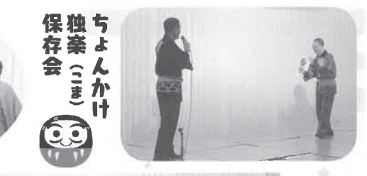
ちよんかけ独楽(こま)保存会