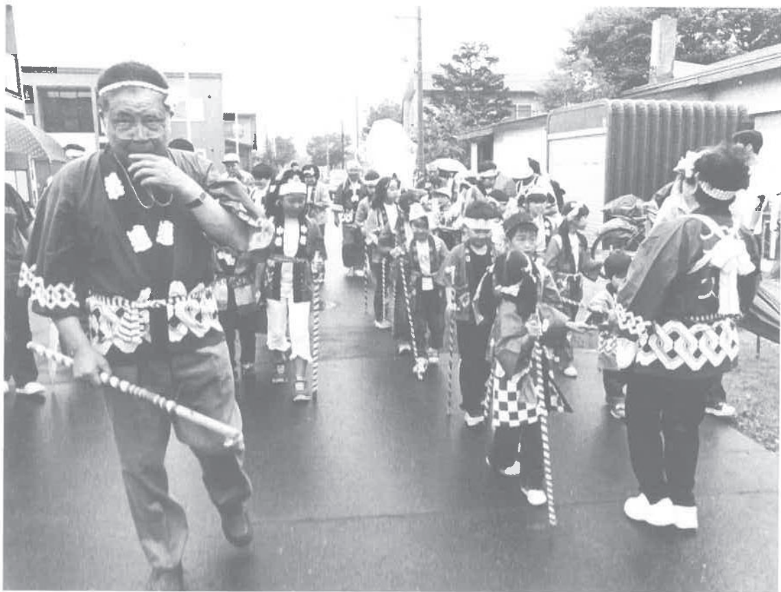
町内会子どもみこしの様子

また、市街地町内会共通の問題であるマンション等集合住宅世帯の町内会加入率が低いため、市町連が提出する加入率促進方策とタイアップして行事を通じた呼びかけ特に子供達による呼びかけを重視して交流の輪を広げて行きたいと思っております。