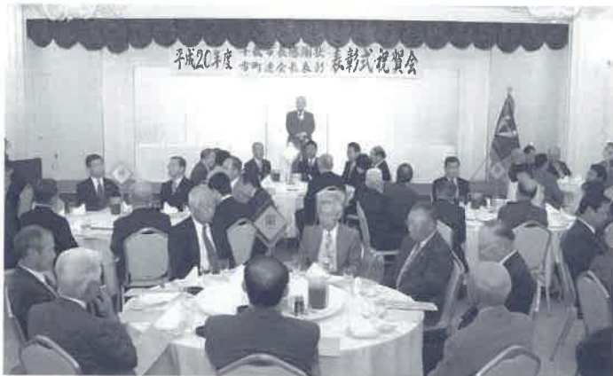
市町連定期総会 表彰式・祝賀会